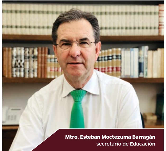
Mtro. Esteban Moctezuma Barragán secretario de Educación